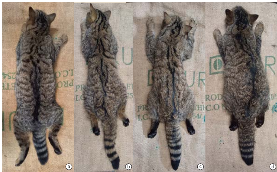
FIGUUR 4 Hybridisatie blijkt fenotypisch moeilijk vast te stellen. Hierbij enkele voorbeelden van de genetisch bemonsterde dieren uit deze studie. a: F1 hybride WK23-5-F; b: Wilde kat WK23-6-M; c: Wilde kat WK23-7-M; d: Backcross Wilde kat WK23-8-M.