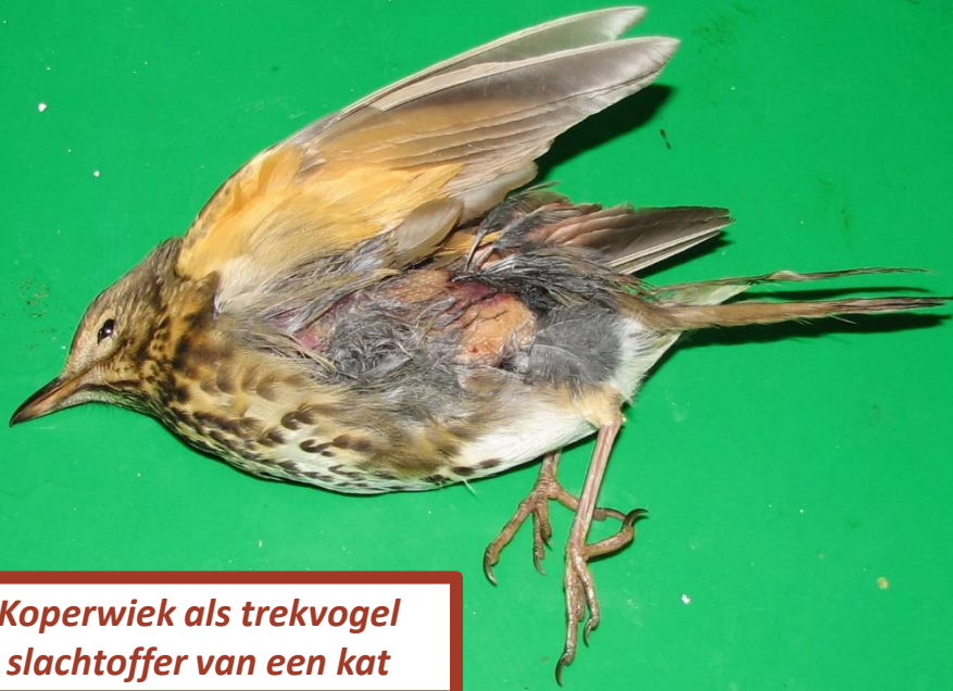
Koperwiek als trekvogel slachtoffer van een kat