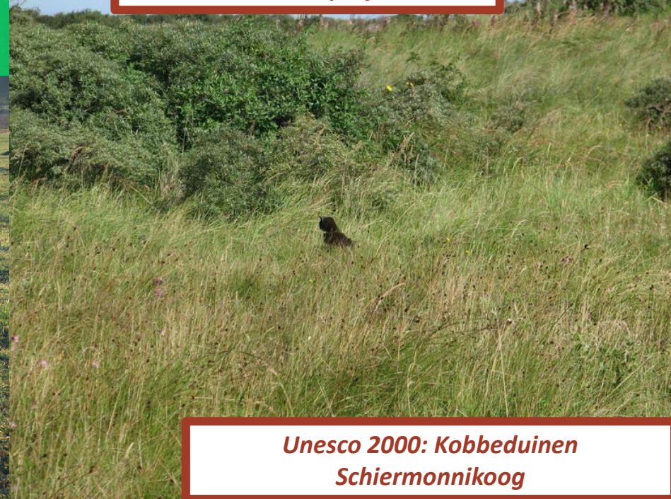
Unesco 2000: Kobbeduinen Schiermonnikoog