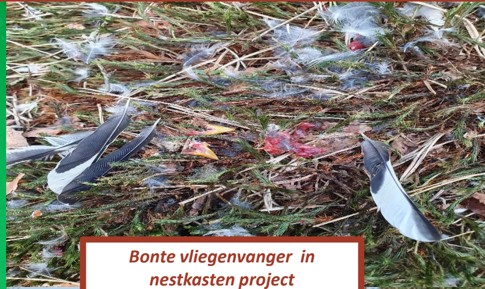
Bonte vliegenvanger in nestkasten project