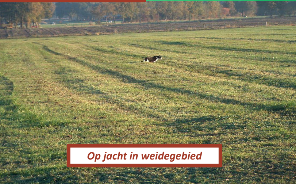
Op jacht in weidegebied